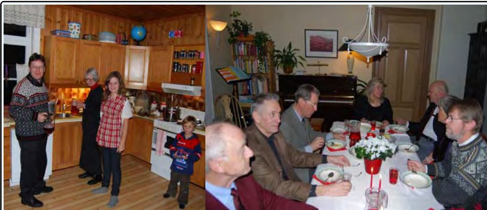
Fra julemøtet i prestegården ved Dypvåg kirke