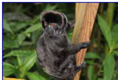
Hva ser dere på ?

"Den Lille Dyrehage kan nå med stolthet vise frem Norges flotteste Regnskog! En magisk innendørs attraksjon på 1200m2, som viser frem ett unikt mangfold av planter og frittlevende dyr. Alt oppleves i ett helt spektakulært miljø. Dette må bare oppleves!