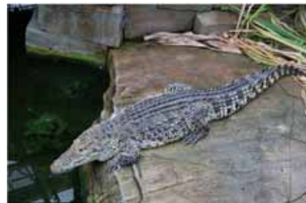
Kommer det noen å ser på i dag,-tro?

med og som med glede ser hvor langt de er kommet. De ønsker ikke å bli en stor kommersiell bedrift, men de ønsker å tilby gode opplevelser for besøkende og et trygt miljø for dyrene. De ville fortsatt ha kontakt med besøkende både i kasse, på foring, på omvisning og være de som sa farvel ved dagens slutt.