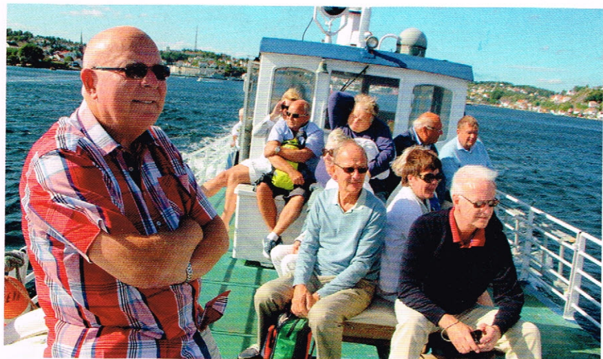
Godt sommervær og stø kurs ut fra Arendal mot Store Torungen Fyr.

Sommermåneden juli er en måned med stor aktivitet i Tvedestrand Rk. Mange sommergjester på besøk i klubben og gode, inspirerende foredrag på klubbkveldene. Dessuten gjennomføres et av klubbens prosjekter i juli, den årlige sommerturen, der gjester med ledsagere eller venner, samt klubbens egne medlemmer med følge, blir invitert til et reisemål som kanskje de fleste ikke ville dra til på egen hånd.