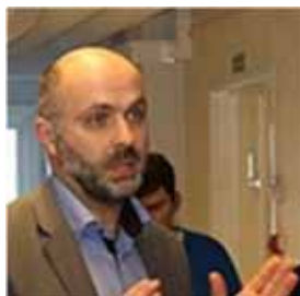
Arkivbilde av foredragshoderen

Hanken startet foredraget med å opplyse at Tvedestrand kommune hadde flere innbyggere ved kommunesammenslåingen i 1960 enn det vi har i dag. I nordisk målestokk har vi i dag mange