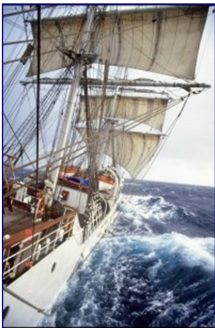
Christian Radich, — for fulle segl.